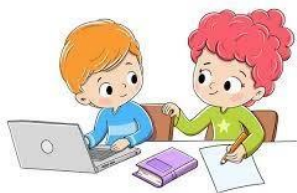
ESTUDAR / FAZER TAREFA