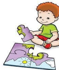
BRINCAR / JOGAR

B – QUAIS ATIVIDADES VOCÊ REALIZA PELA MANHÃ?